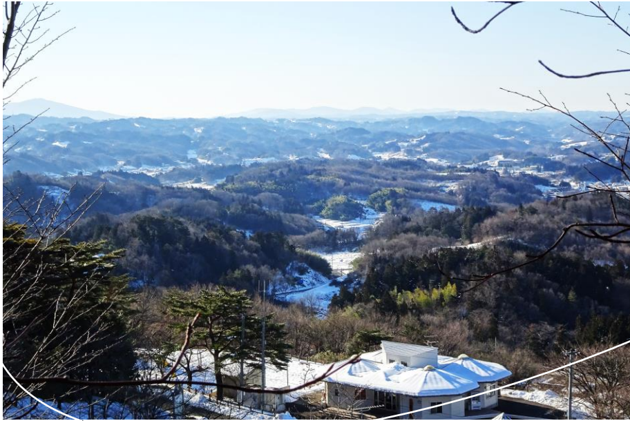
千貫森からの眺望(2月撮影)